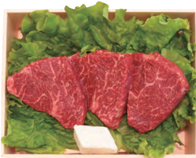
15 赤城和牛 モモステーキギフト AKG-3 5,800円 (80・冷蔵) 赤城和牛といばこれ。 本当に美味しい赤身肉をステーキで。 180g×3枚