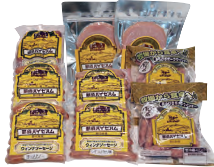
18 那須野ヶ原 郡司牧場 那須バイゼハムギフト② GJ-2 3,800円 (80・冷蔵) ロースハム100g×2 ウインナー (チョリソー140g×2 レモン&パセリ140g×2/ あらびき150g×2) フランクフルト240g×1