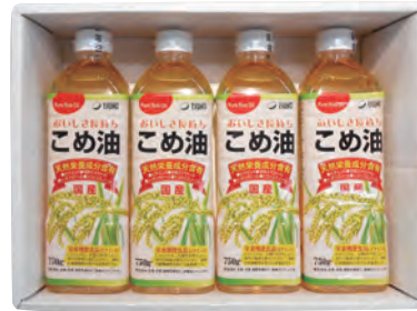
21 築野食品 こめ油セット MS-D 2,750円 (80) 750g×4本 当店の“お惣菜コーナー”でも 使用しているこめ油です。