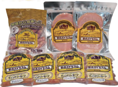
17 那須野ヶ原 郡司牧場 那須バイゼハムギフト① GJ-1 2,800円 (80・冷蔵) ロースハム100g×2 ウインナー (チョリソー140g×2 レモン&パセリ140g×2/ あらびき150g×1)

徹底した安全管理のもと、品種や飼料にこだわり健やかに育った白豚。この環境でしか生み出すことの出来ない、極上のお肉は、甘味のある脂身にジューシーでやわらかい肉質。まさに最高と呼ぶに相応しい、自信を持ってお勧めする一品です。そんな極上な素材を天然の塩と、選び抜いた香辛料で心を込めて造り上げています。