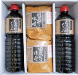
20 三樹屋推奨品 二年熟成しょうゆもろみ 田舎づくり味噌詰合せ S-M1 2,592円 (80・冷蔵) 二年熟成しょうゆもろみ1L×2 田舎づくり味噌1kg×2

素材の持ち味を活かし、さらっとした風味の良いこめ油です。 油っぽくなく、冷めてもカラッとした食感です。