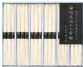
23 後文 稲庭本手延素麺ギフト SO-30 3,240円 (80) 60g×18束入