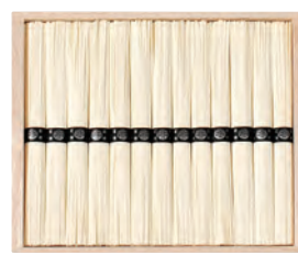
24 坂利製麺所 手延べ葛そうめんギフト E-20 2,160円 (60) 50g×13束入