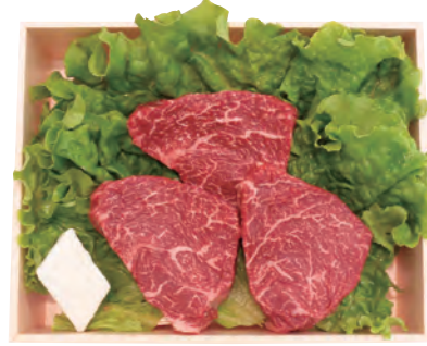
16 しあわせ絆牛 ランプステーキギフト SKR-1 4,000円 (80・冷蔵) 高品質交雑牛「しあわせ絆牛」の ランプステーキです。当店大人気商品です。 180g×3枚