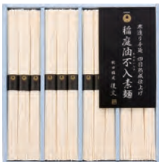
22 後文 稲庭本手延素麺ギフト SO-20 2,160円 (60) 60g×12束入

国産小麦に本葛を加え、丁寧に手延べ致しました。葛入りならではのツルツルとした喉越しと、手延べによるコシの強さが自慢です。