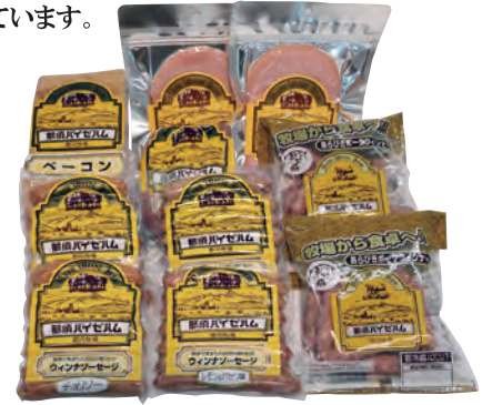
19 那須野ヶ原 郡司牧場 那須バイゼハムギフト③ GJ-3 5,800円 (80・冷蔵) ロースハム100g×2 ウインナー (チョリソー140g×2 レモン&パセリ140g×2/ あらびき150g×2) フランクフルト240g×1/ パラベーコン約600g