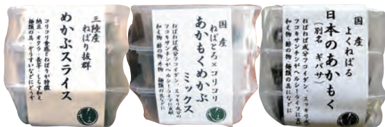
＜そのままはもちろん、たまごや、ひや汁にもあいます＞

全国を回って自ら実演販売をしている、(株)リアスのわかめアニキが来店します。今注目のスーパーフード「あかもく」や「めかぶ」、石巻十三浜産の新物わかめなどおいしい海藻を紹介いたします。